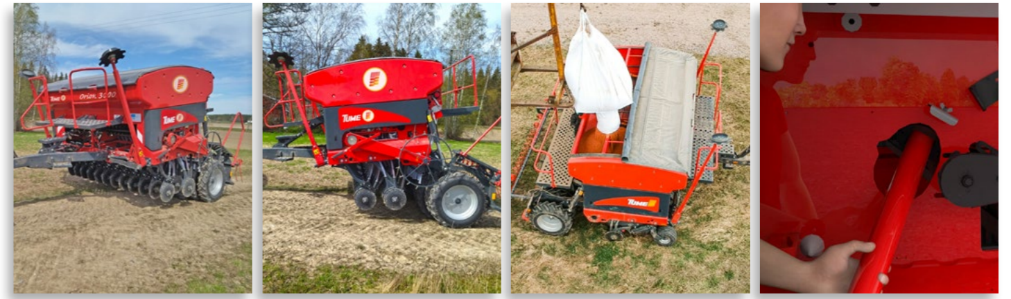
Orionin säiliörakenteessa tulevat vakiona turvalliset ja tukevat astintasot, molemminpuolin rullautuva jousipressu sekä jokaisessa säiliön nurkkauksessa olevat tyhjennysventtiilit.