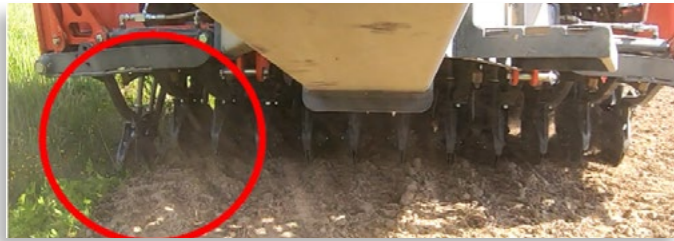
Kuva 2. Orionin vantaiston vahvuus on sen geometria ja poikkeuksellisen laaja liikerata niin ylös- kuin alaspäin. Tämä mahdollistaa onnistuneen kylvön vaatimattomammankin kylvömuokkauksen jäljeltä.