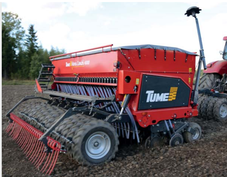
Hydrauliska markörer Frölåda Efterharv